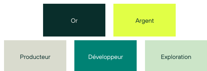
Exemple de titres en portefeuille

À titre indicatif seulement. Voir la répartition sectorielle pour connaître les titres en portefeuille.