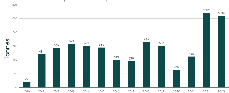
Achats d'or par les banques centrales et les institutions

L'or et les autres métaux précieux sont l'un des actifs les plus anciens à servir de réserve de valeur, offrant une couverture potentielle contre les risques d'inflation, de crédit et de change.